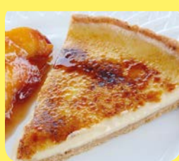
la crema bruciata