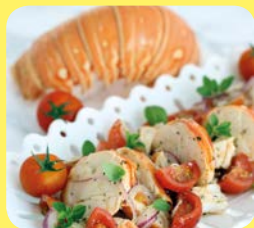
l'aragosta alla catalana