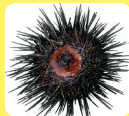
il riccio di mare